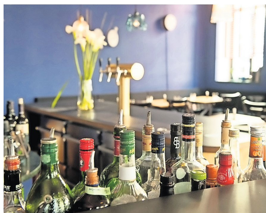
Die kleine, vierzehntägig wechselnde Karte im Schwabinger Restaurant Capri erlaubt sich einige Eigenwilligkeiten.

Öffnungszeiten Montag bis Samstag 18.00 bis 1.00 Uhr, Sonntag Ruhetag