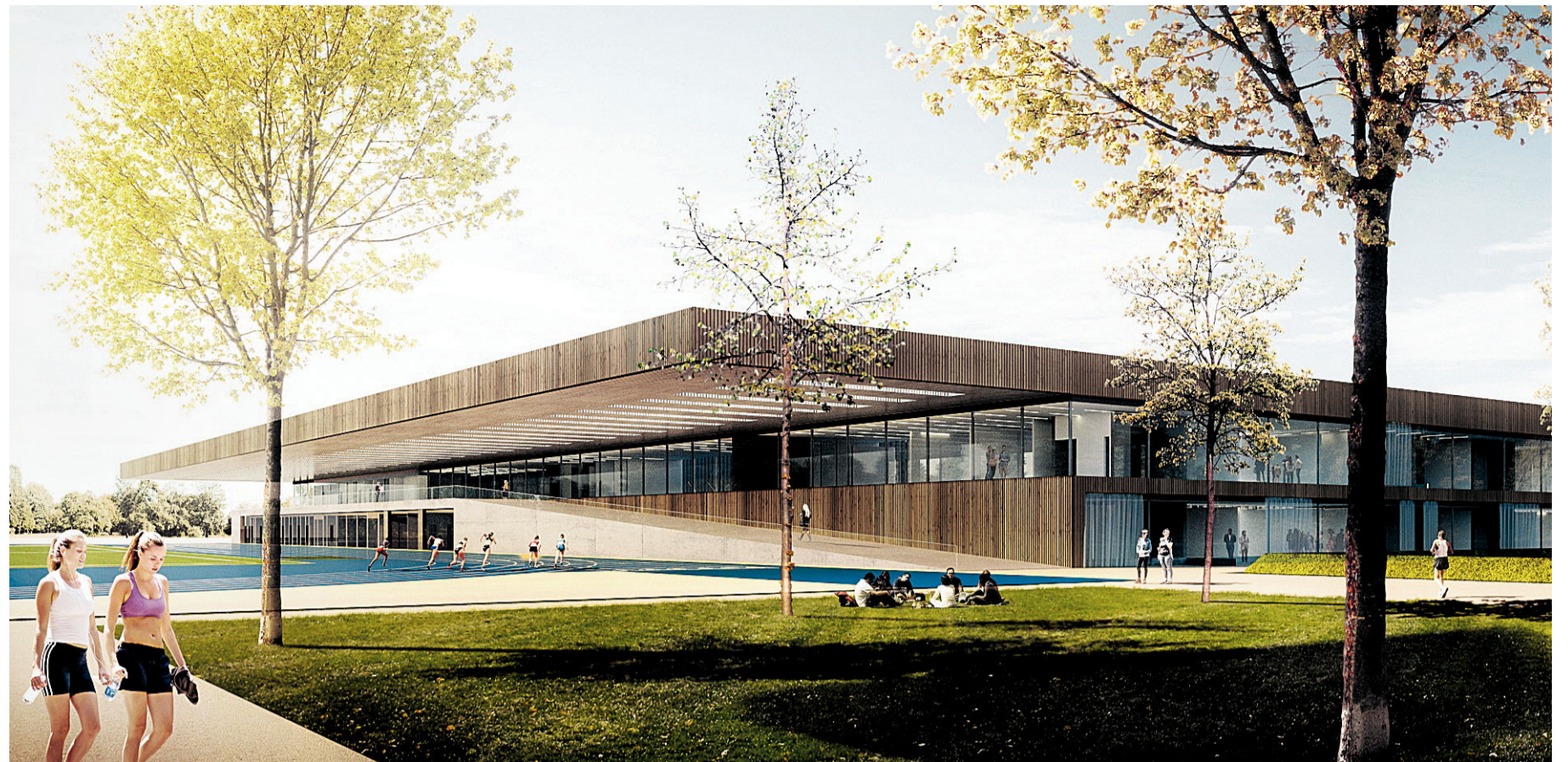
Das Preisgericht lobte den „klaren, ruhigen Baukörper“ mit der Holz- und Glasfassade, der sich gut in den Park einfügt. SIMULATION: DIETRICH UNTERTRIFALLER ARCHITECTEN TZ GMBH