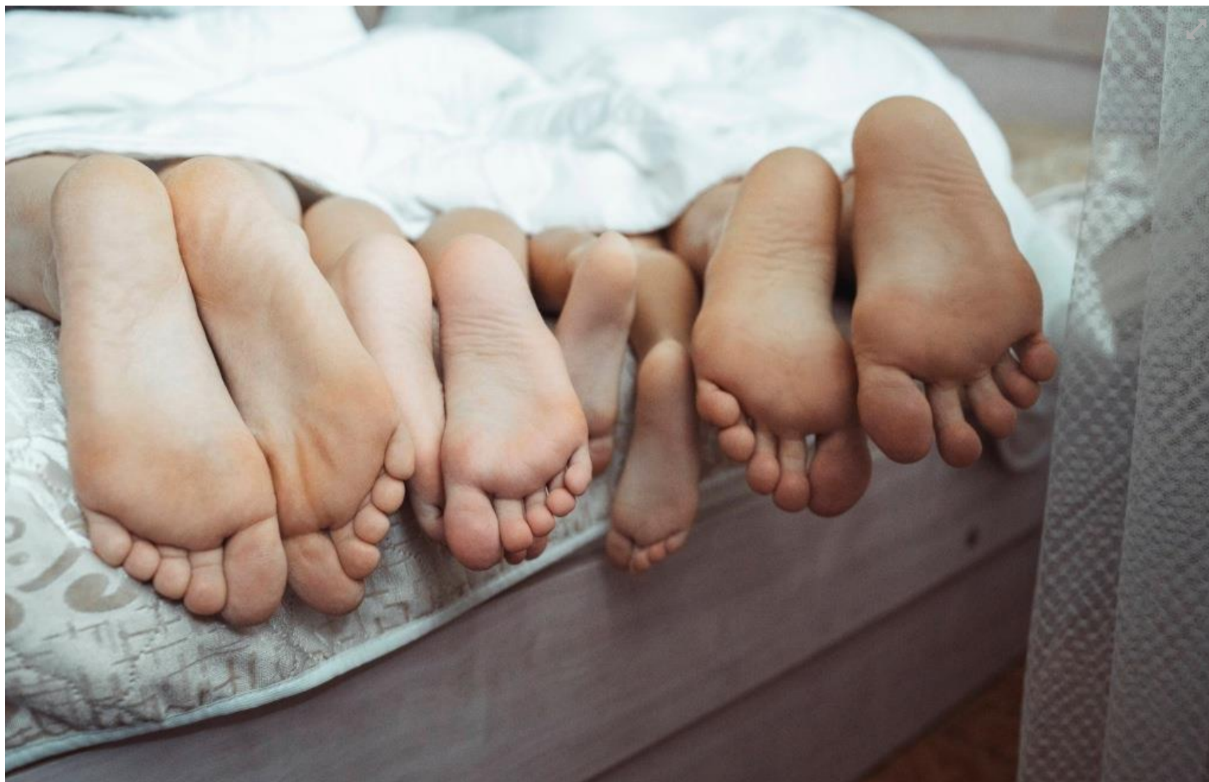
Kinder schlafen zwischen Mama und Papa wie Marmeladentiere. Allerdings sollten auch die Eltern auf mindestens sieben Stunden Nachtruhe kommen, um ihrer Gesundheit und ihrem Wohlbefinden etwas Gutes zu tun.