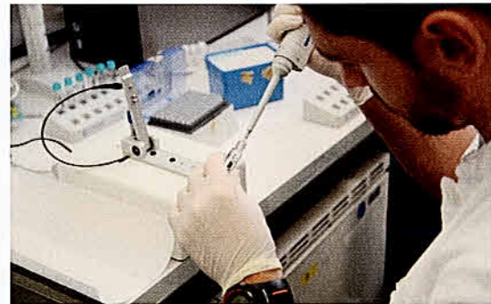
In den Laborwerten spiegelt sich der Trainingseffekt wider.

Biomarker, die Auskunft geben über Fitness, Gesundheit oder Trainingsanpassung einer Person, sind zum Beispiel die Konzentrationen von Blutzucker oder Laktat. Um »Trainingsbiomarker« zu identifizieren, haben die Studierenden detailliert die körperliche Fitness – etwa in Analysen von Atemgas, Herz-Kreislaufwerten und Muskelkraft –, die Körperzusammensetzung (Körperfett) und eine Vielzahl an biochemischen Parametern der Probanden vor und nach dem kombinierten Kraft- und Ausdauertrainingsprogramm gemessen. In Kooperation mit dem Institut für Bioinformatik und Systembiologie des Helmholtz Zentrums München wurde das »Metabolom« analysiert, das den Stoffwechsel der Probanden abbildet.